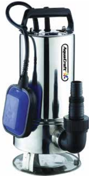
CSP 1100 -1A