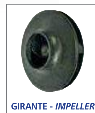
GIRANTE - IMPELLER