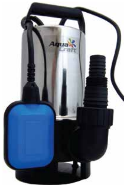
■ CSP 750-3A ■ CSP 1100-3A